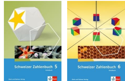
Abbildung 1: Neuauflagen Schweizer Zahlenbuch 5 und 6, Klett Verlag

Dieses Dokument ist eine Ergänzung zu den Materialien des Klett Verlags und soll Lehrpersonen unterstützen, die mit dem Schweizer Zahlenbuch unterrichten.