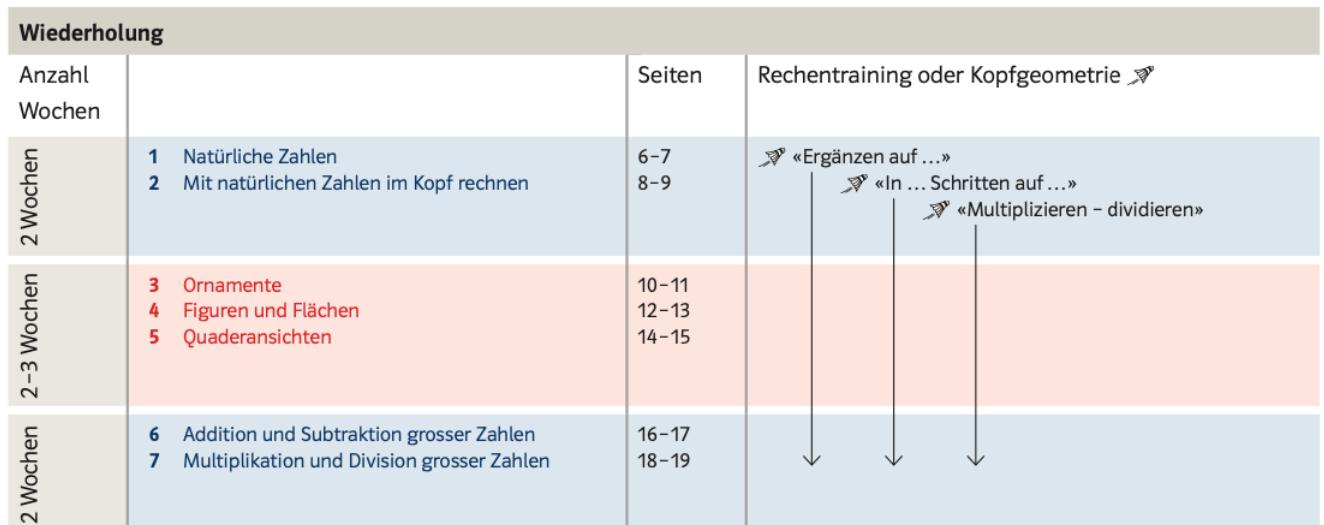
Abbildung 2: Auszug Jahresplanung Schweizer Zahlenbuch 5, Ausgabe 2017 Verfügbar unter https://downloads.klett.ch/uploads/images/textbooks/Dateien/Schweizer-Zahlenbuch-Neuausgabe-5-Jahresplanung-klett-und-balmer.pdf