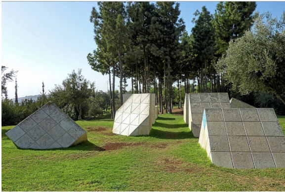
Max Bill in Jerusalem

Auf dem Internet findest du unter dem Begriff „Max Bill Würfelschnitte“ ganz viele spannende Bilder.