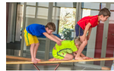
über Partner steigen