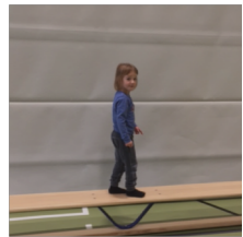
auf den Zehen