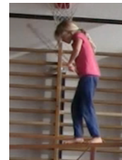
rückwärts durch Reifen steigen