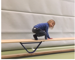
auf allen Vieren