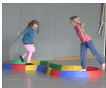
Kunststück auf einem Bein