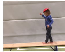
etwas auf dem Kopf tragen