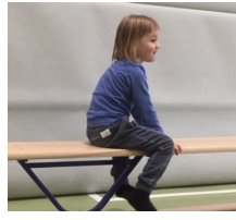
sitzen und rutschen