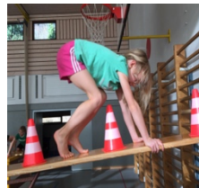
über etwas steigen