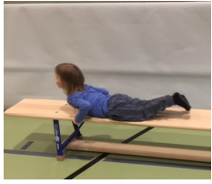
auf dem Bauch rutschen